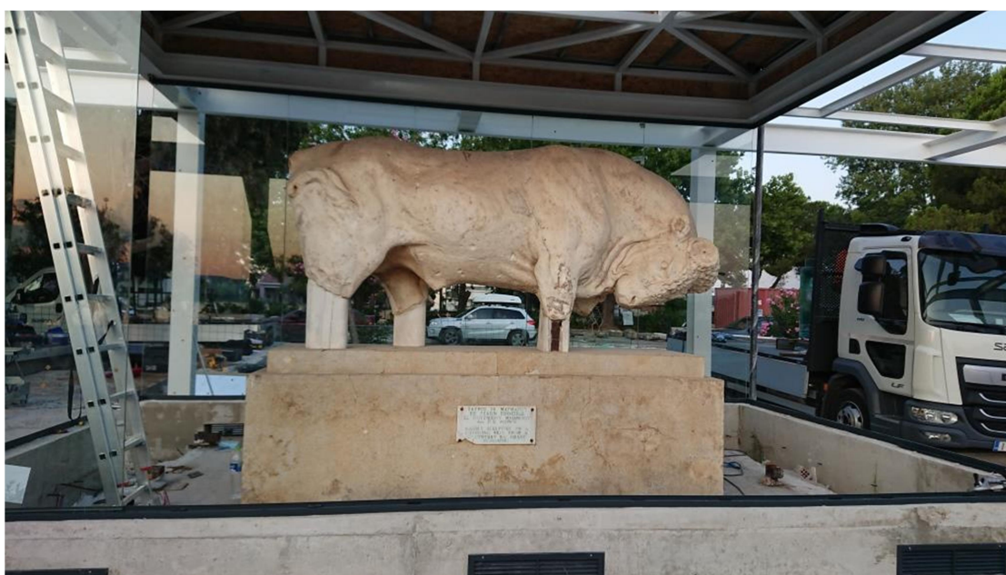
Η αποκάλυψη του γλυπτού