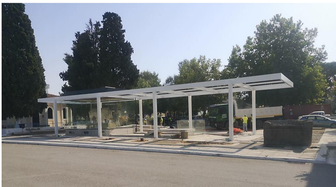
Η επόμενη μέρα