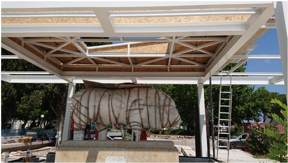
Έναρξη εργασιών τοποθέτησης νέου στεγάστρου