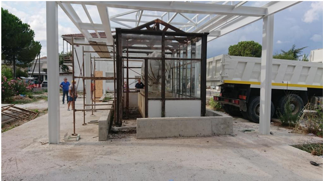
Καθαίρεση του παλαιού ξύλινου στεγάστρου