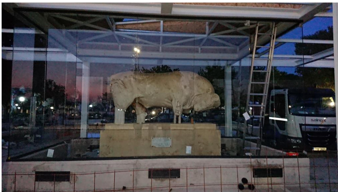
Ολοκλήρωση τοποθέτησης κρυστάλλων